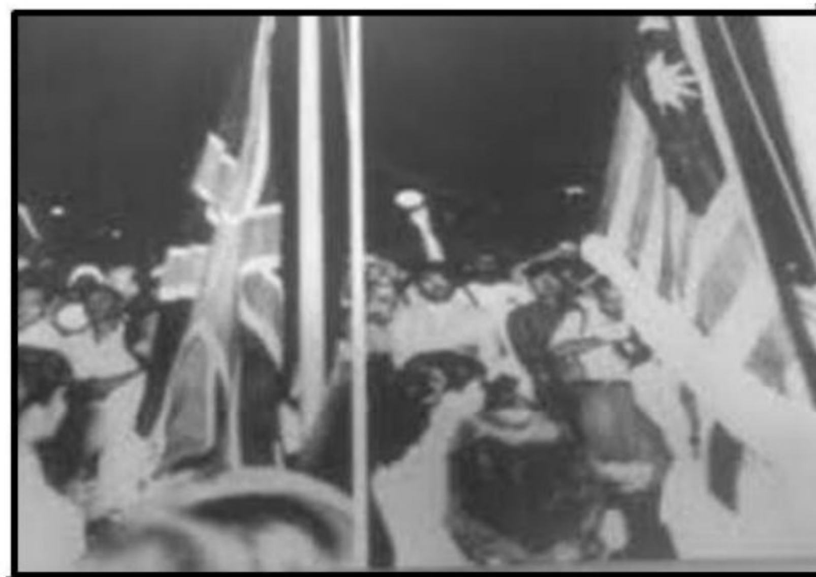
Bendera Union Jack diturunkan dan Bendera Persekutuan Tanah Melayu dinaikkan