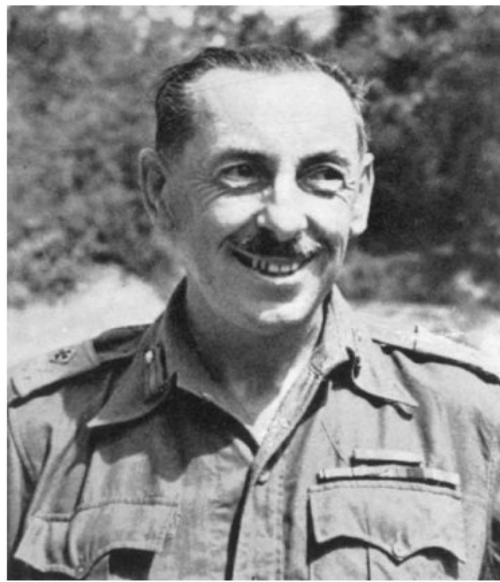
Sir Harold Rowdon Briggs

12 Gambar berikut menunjukkan Pengarah Operasi dalam Rancangan Briggs.